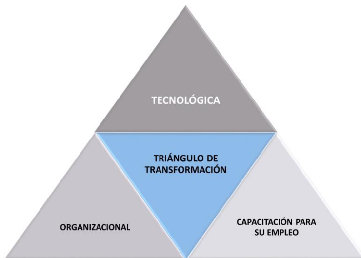
Figura 2. Componentes del triángulo de transformación

Como resultado del análisis teórico realizado y de la aplicación del instrumento encuesta a los profesores y especialistas se obtiene el triángulo de transformación, cuya representación se muestra en la figura 2.