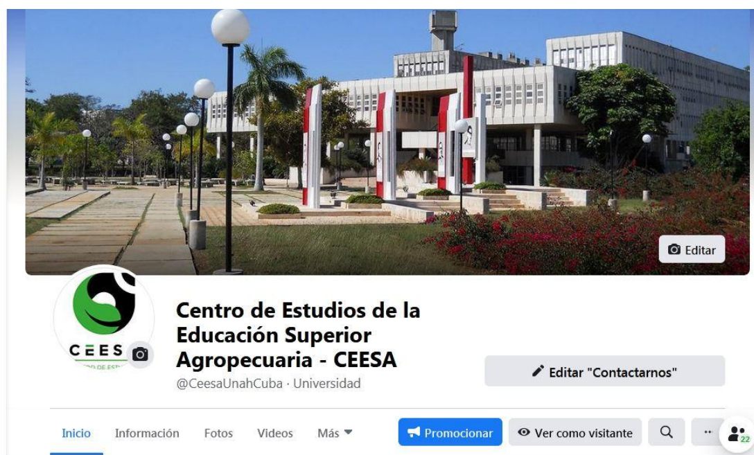
Figura 1: Espacio de intercambio social CEESA

A partir del espacio de Facebookceesa se pudo acceder a la orientación de los docentes con una experiencia práctica del uso de las estrategias de enseñanza en las conferencias.