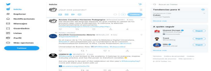
Figura. 2: Perfil de twitter