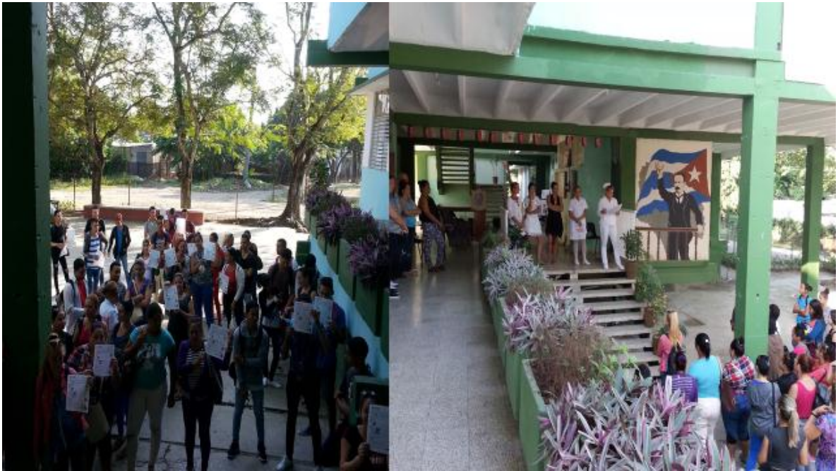
Alumnos haciendo el recorrido por las salas

Talleres que oferta salud como parte del convenio con esta agencia, capacitación con un carácter preventivo en la escuela: grupal e individual según necesidades.