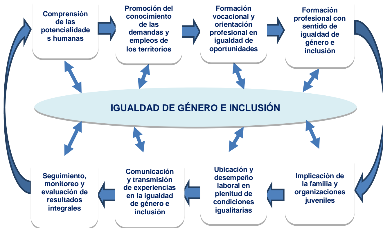
Diagrama de articulación de las Líneas estratégicas

inclusión en el proyecto PROFET y que a su vez la aplicación de sus conceptos y principios influyen directamente en los procesos relacionados.